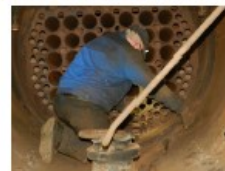
La dépose des tubes, côté boîte à fumée

C'est une entreprise polonaise qui nous a fourni les nouveaux tubes mais à une longueur supérieure à ce qui avait été demandé. Pas par incompétence, mais pour que ses clients disposent d'une marge de manœuvre. En effet, au fil du temps et des interventions, la longueur entre le foyer et la boîte à fumée peut varier d'un tube à l'autre. Il a donc fallu ajuster chaque tube à sa longueur exacte, sachant aussi que chaque tube devait être évasé du côté de la boîte à fumée.