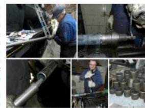
Le travail sur les nouveaux tubes, avant leur pose

Certains n'ont pas ménagé leur peine pour ce travail colossal, allant jusqu'à faire des nocturnes jusque minuit.