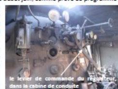
le levier de commande du régulateur, dans la cabine de conduite

Après examen avec une caméra d'exploration, le verdict est tombé : le tube qui conduit la vapeur vers les cylindres est hors d'usage. Explication technique : la vapeur produite dans la chaudière monte dans le dôme, au-dessus de la chaudière. Là se trouve le régulateur, un peu l'équivalent de l'accélérateur d'une voiture. Lorsque le mécanicien veut de la puissance, il ouvre le régulateur grâce au levier de commande situé en cabine. La vapeur libérée est dirigée, par un tube, vers le collecteur et les tubes de surchauffe (elle gagne en température au-dessus de sa température de saturation, risque moins de condenser, et est donc plus efficace) puis dans les cylindres. Ce tube est donc une pièce vitale.