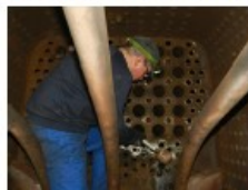
La dépose des tubes, côté foyer

Pendant l'intersaison, le travail n'a pas manqué sur la Ty2 6690. Outre la maintenance courante, il a fallu changer les 112 petits tubes à fumée de la chaudière. Ces tubes, qui parcourent les fumées sortant du foyer, transmettent la chaleur des fumées à l'eau de la chaudière, pour porter cette eau à ébullition et produire la vapeur nécessaire à la locomotive. Au fil du temps, ils se dégradent et finissent parfois par fuir.